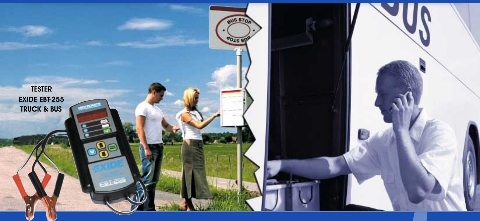
TESTER EXIDE EBT-255 TRUCK & BUS